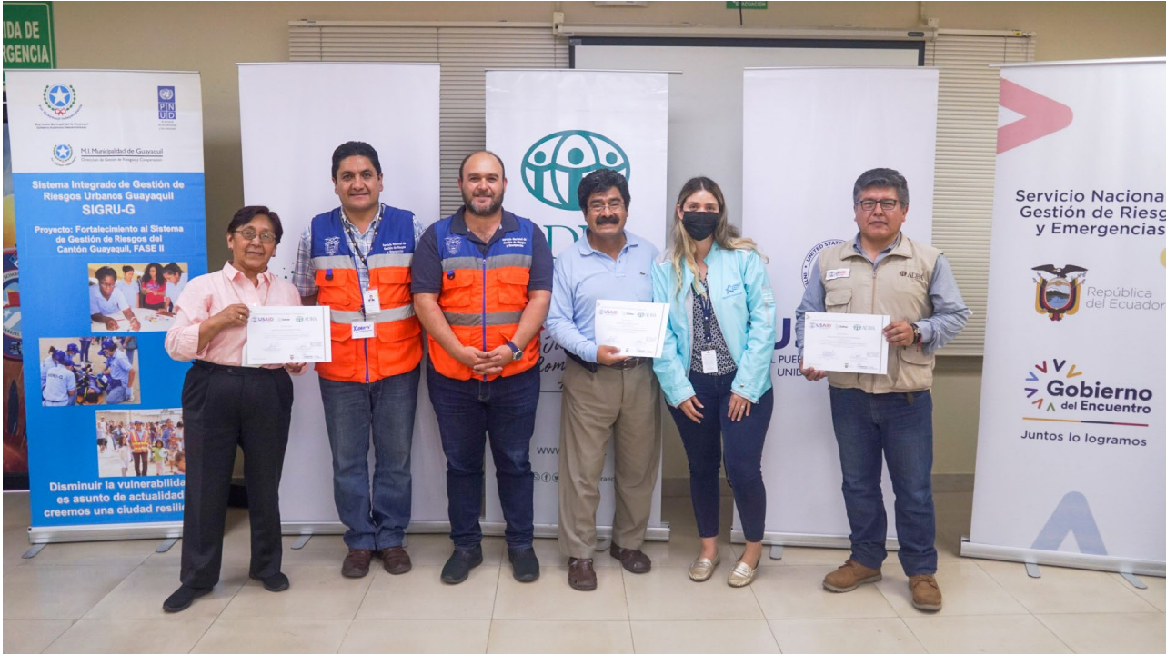
فريق تدريب اسفير في دورة اسفير لصناع القرار في جواياكيل، الإكوادور، في مايو 2022، حيث تم تجريب النسخة الإسبانية من هذه المواد التدريبية.