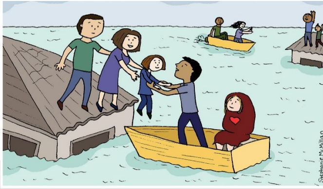
ملصق رقم 1

كنشاط جماعي كامل، اطلب من المشاركين إلقاء نظرة على الملصق رقم (1) والإجابة على الأسئلة التالية: