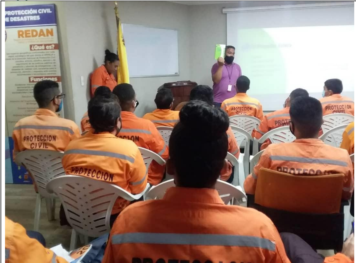
Mostrando el manual anterior y el manual vigente 2018 digital