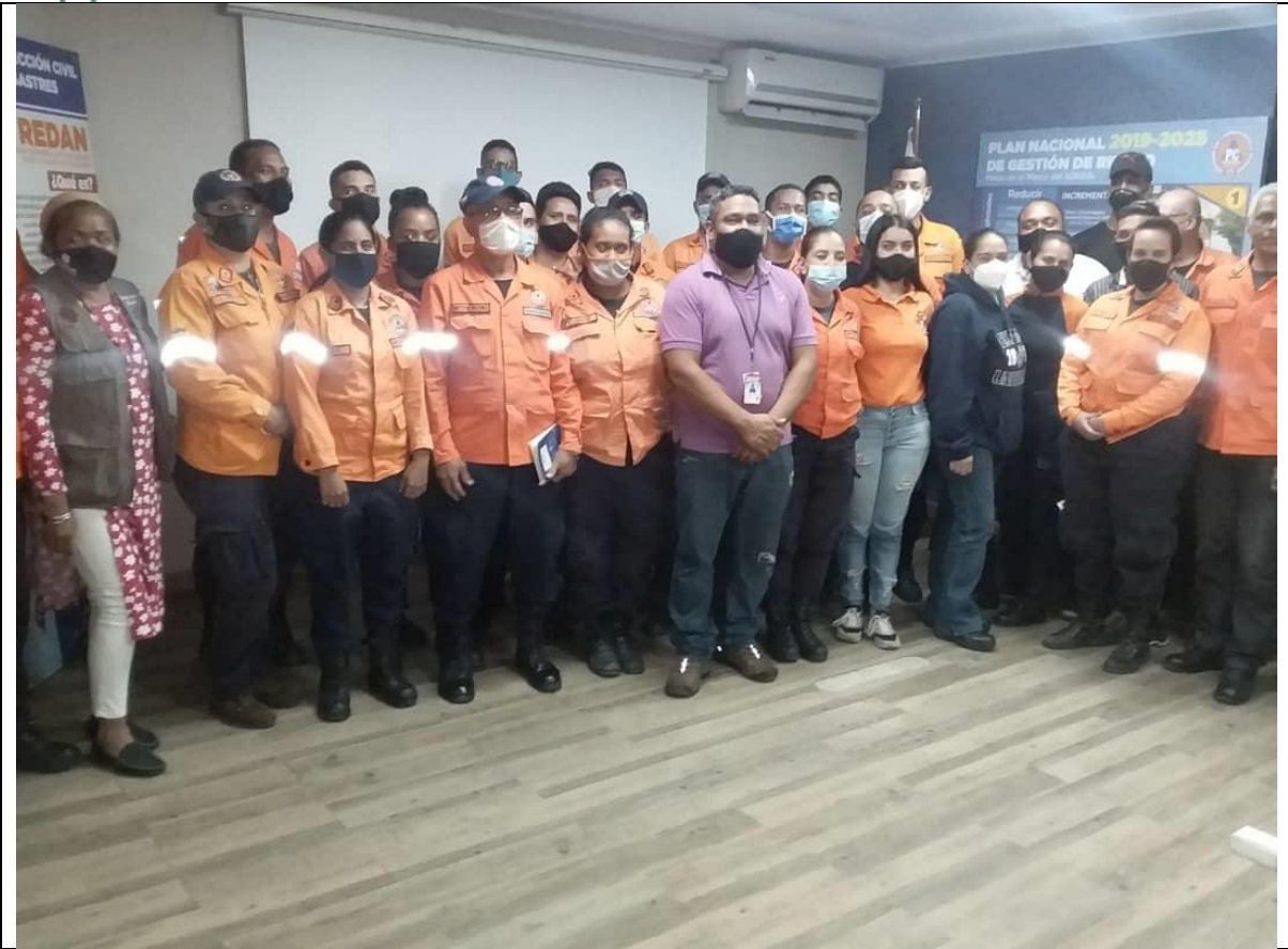
Funcionarios de la Dirección Nacional de Protección Civil